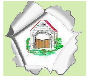
Bayenghem - lez- Eperlecques

Op 15 november 2015 werd namens de Raad van de Beigemse Verenigingen volgend rouwbeklag overgemaakt aan de burgemeester van Bayenghem - lez- Eperlecques :